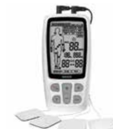
NANO Pain Relax RC48 uređaj za elektroterapiju