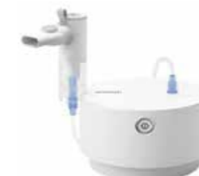
OMRON C28P kompresorski inhalator