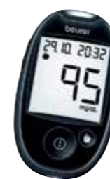
BEURER GL44 glukometar