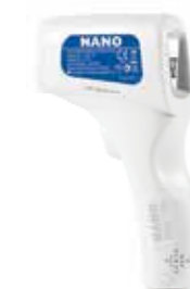
Nano Thermo Smart T3 beskontaktni infracrveni toplomjer