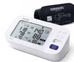
OMRON M6 Comfort tlakomjer za nadlakticu

Pjesma je objavljena u zborniku „100 hrvatskih pisaca“ Matica hrvatska, 1991. godine