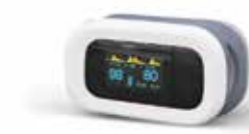
NANO Oxi Plus pulsni oksimetar za prst