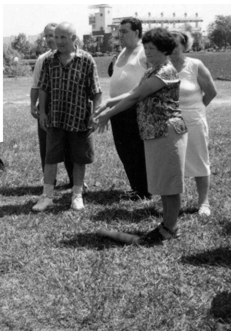
• Kuglana - sportske aktivnosti na Jarunu - druženje članova