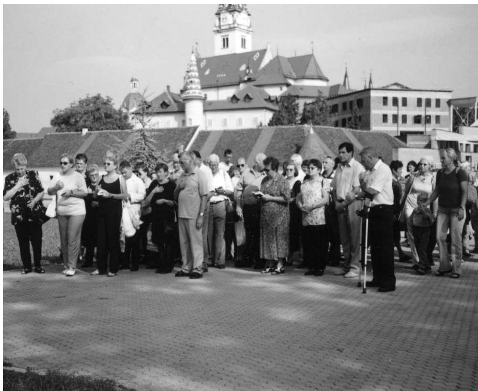
• Hodočašće u Mariju Bisticu (kolovoz, 2002. godine)

Inače, prošlih godina organizirani su izleti u Međugorje i Trsat te višednevni izlet u Rim, a jednom su predstavnici Udruge prisustvovali audijenciji kod Svetog Oca.