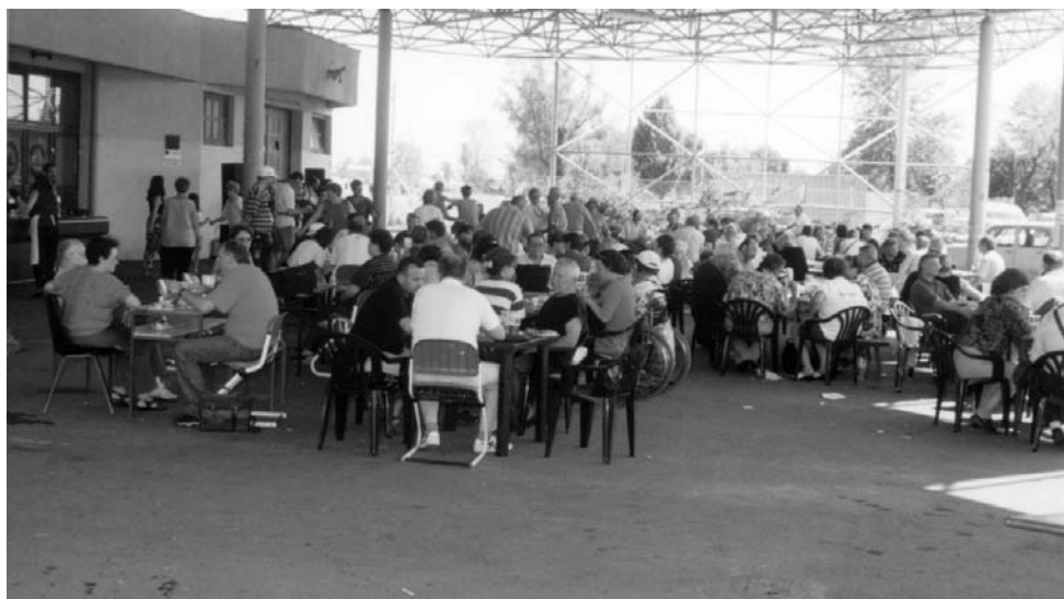
• Sa druženja na Jarunu

Aktivisti Udruge potrudili su se osigurati dobru zabavu tako da se uz dobro jelo i piće moglo i zaplesati uz glazbeni sastav «Kad-Tad».