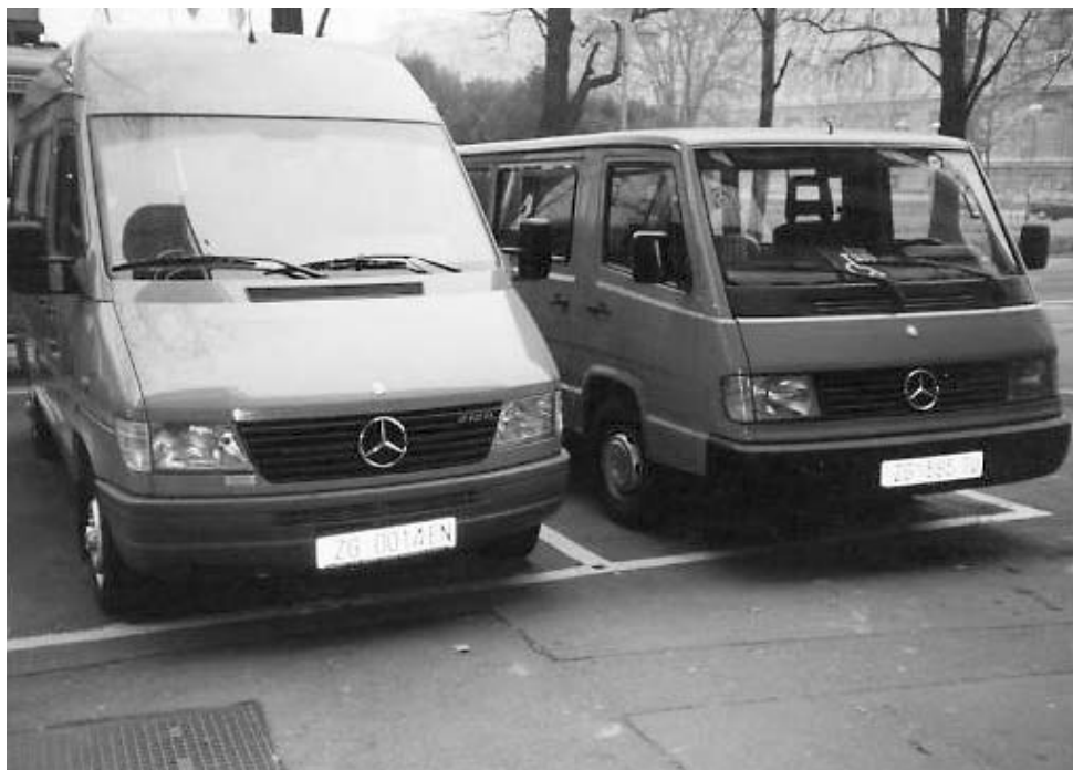
• Kombi vozilo: Udruga i Sportskog društva

Očekivanom adekvatnom financijskom podrškom navedene bi aktivnosti bitno utjecale na djelotvornije poboljšanje uvjeta življenja invalida naših članova.