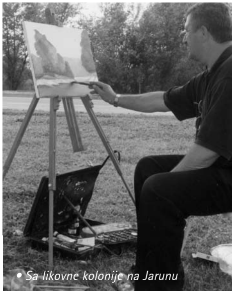
• Sa likovne kolonije na Jarunu

Želimo se ovom prigodom najtoplije zahvaliti upravi SRC Jarun i Vatrogasnoj upravi grada Zagreba s kojima u vezi organiziranja naših susreta s kojima imamo odličnu suradnju.