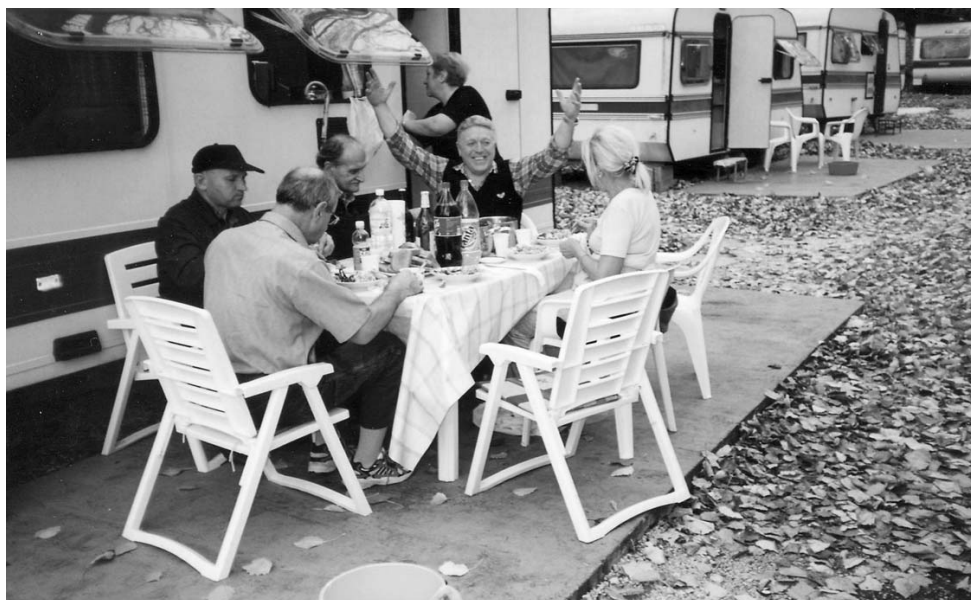
• Auto-camp "Uvala Slana" - nakon rada zasluženi odmor