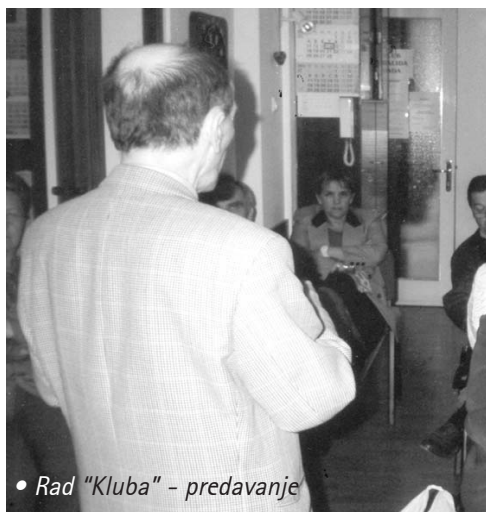
• Rad "Kluba" - predavanje