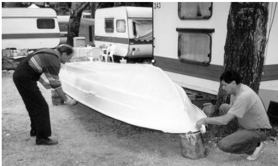
• Auto-camp "Uvala Slana" - izrada čamca za potrebe Udruge