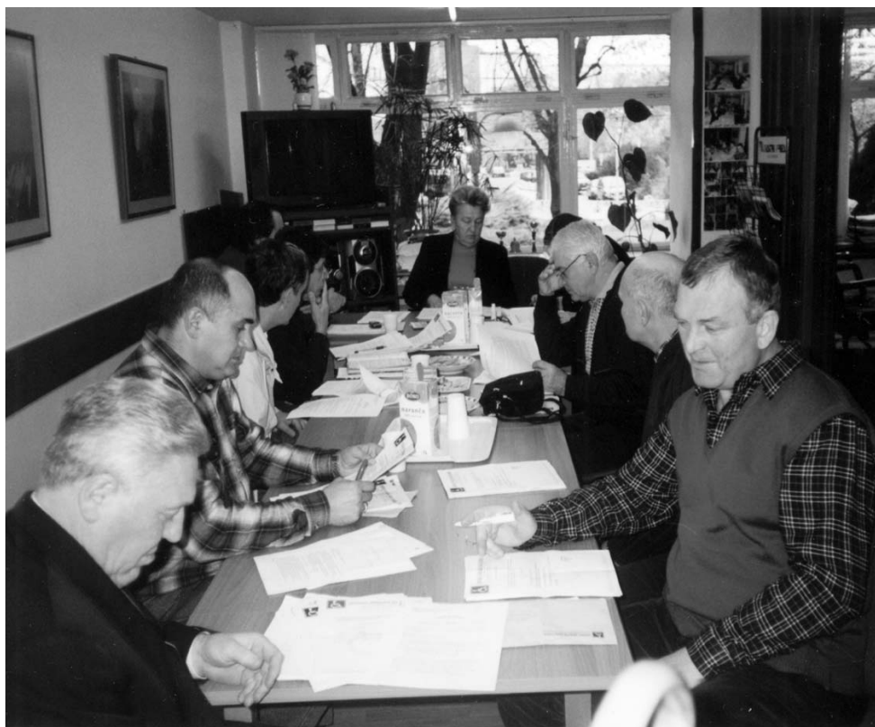
• Sjednica Izvršnog odbora