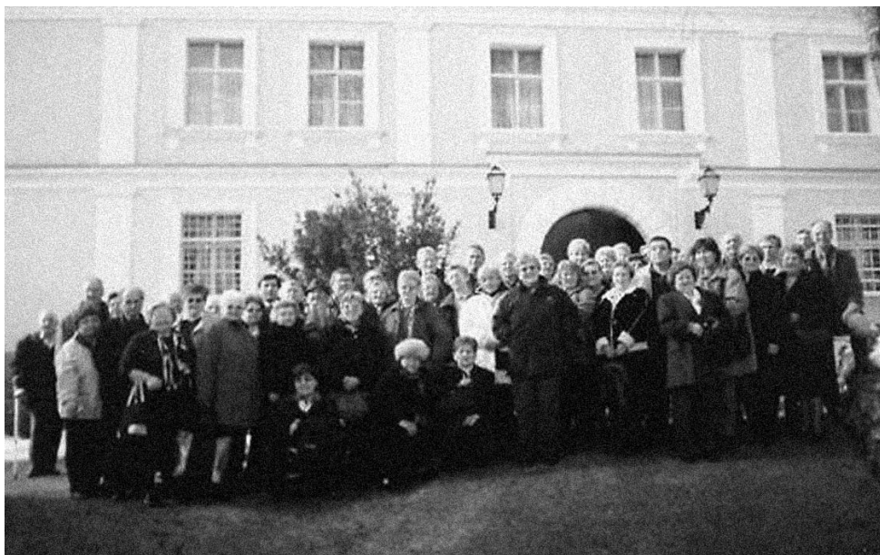
• Izlet u Hrvatsko Zagorje