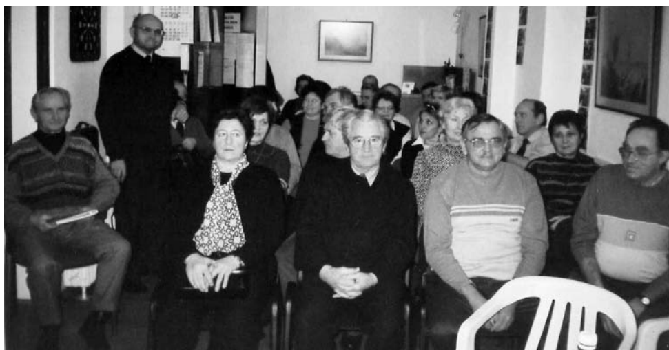
• Posjetitelji večeri poezije u Klubu invalida