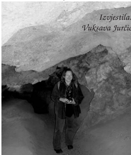
Izvjestila: Vuksava Jurčić