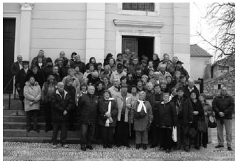
Ispred župne crkve Sv. Filipa i Jakova